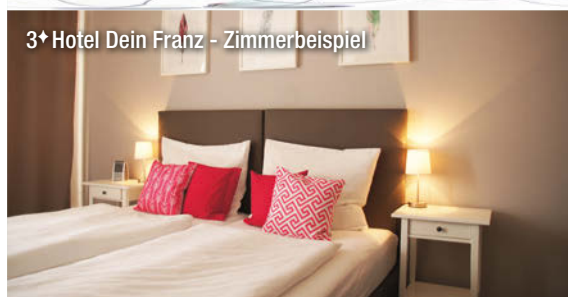
3* Hotel Dein Franz - Zimmerbeispiel