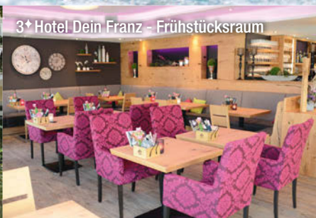
3* Hotel Dein Franz - Frühstücksraum