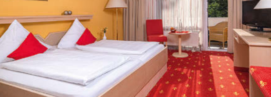
3+ Kurhotel Panland - Zimmerbeispiel