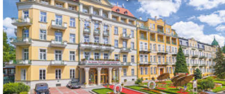
4+ Spa Resort Pawlik-Aquaforum

Freizeit/Kur/Unterhaltung: Durch einen beheizten Korridor ist das Spa Resort direkt mit dem Kaiserbad, der neuen Kurklinik und dem Aquaforum verbunden. Das Aquaforum mit einer Sauna, drei Innen- und zwei Außenbecken mit Wasserattraktionen sowie zwei Whirlpools gilt als schönste und größte Badelandschaft des Böhmisches Bäderdreiecks. Das ausgezeichnete Kur- und Therapiezentrum im Kaiserbad und die moderne Kurklinik mit ihren wohltuenden Anwendungen runden das Gesundheitsangebot ab. Für den sportlichen Ausgleich sorgt das Fitness-Studio und der Verleih von Fahrrädern und Nordic Walking-Stöcken (gg. Gebühr). Regelmäßig veranstaltete Musik- und Tanzabende sowie zahlreiche Kultur- und Freizeitangebote bieten zudem abwechslungsreiche Unterhaltung.