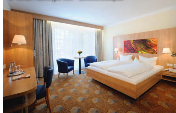
3+ Hotel Füssinger Hof - Zimmerbeispiel