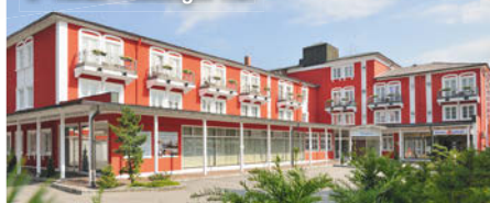
3+ Hotel Füssinger Hof

Verpflegung: Alle Mahlzeiten nehmen Sie in der gemütlich-gediegenen Atmosphäre des Hotelrestaurants ein. Frühstück und Abendessen werden Ihnen hier jeweils als Buffet angeboten. Zum Abendessen sind für Sie zudem die Tischgetränke (Wasser, Kaffee, Tee, Softdrinks, Bier und Hauswein) bereits inklusive.