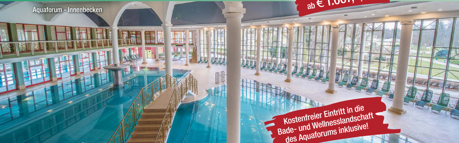
Aquaforum - Innenbecken

Kostenfreier Eintritt in die Bade- und Wellnesslandschaft des Aquaforums inklusive!