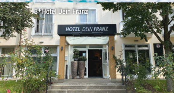
3* Hotel Dein Franz