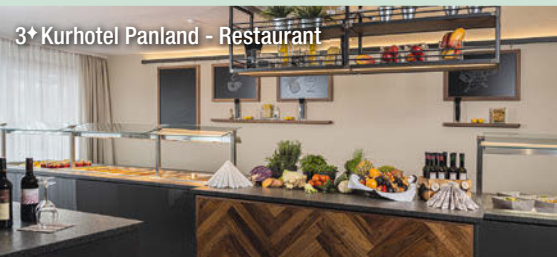
3+ Kurhotel Panland - Restaurant