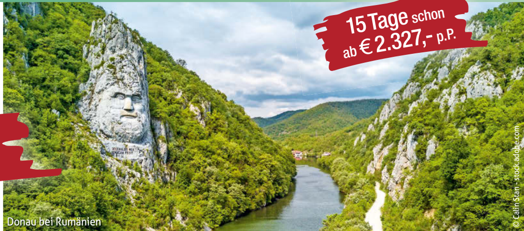
Donau bei Rumänien

Mit Belgrad, der Hauptstadt Serbiens, wartet bereits das nächste Highlight auf Sie. Im Rahmen einer Stadtrundfahrt/-gang (vorab buchbar; B ) besichtigen Sie die Festung Kalemegdan, mit Zeit zum Verweilen. Am Abend bietet sich Ihnen die Gelegenheit eine traditionsreiche Folkloreshow (an Bord buchbar) zu erleben. ➤ Ankunft: 11:00 Uhr ➤ Abfahrt: 23:30 Uhr