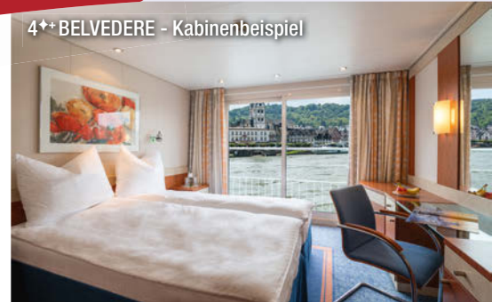
4** BELVEDERE - Kabinenbeispiel