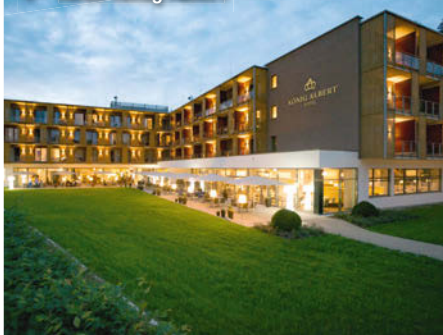
4++ Hotel König Albert

Verpflegung: Am Morgen bedienen Sie sich am reichhaltigen Frühstücksbuffet, das keine Wünsche offenlässt. Das Abendessen wird Ihnen als Buffet im hoteleigenen Restaurant „Musika“ mit großzügigem Innen- und Außenbereich serviert.