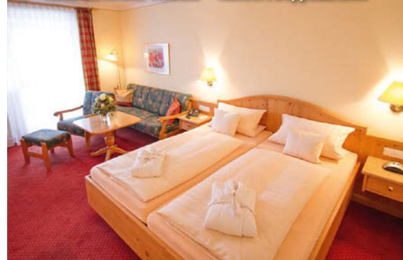
3++ Hotel Birkenhof Terme - Komfort Doppelzimmer