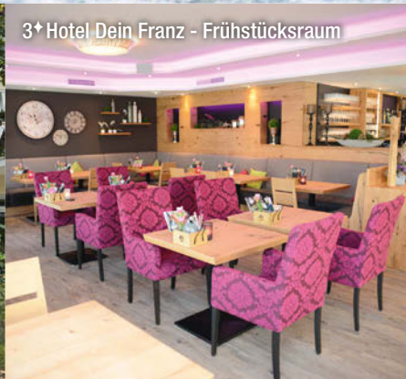
3* Hotel Dein Franz - Frühstücksraum