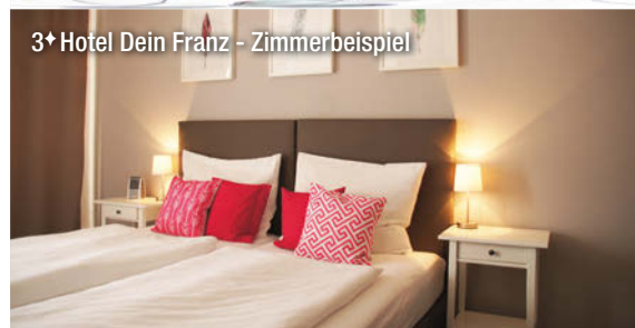
3* Hotel Dein Franz - Zimmerbeispiel