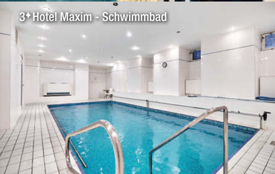
3* Hotel Maxim - Schwimmbad