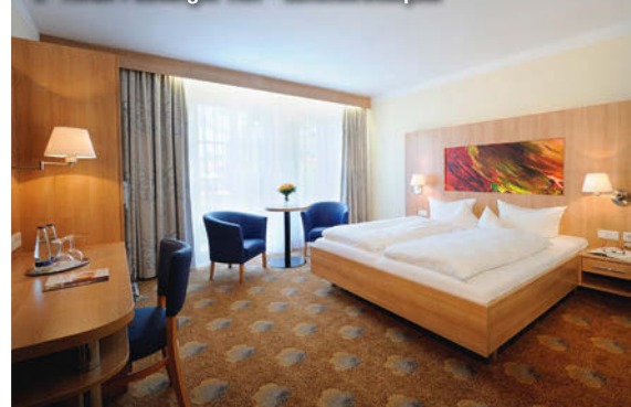
3+ Hotel Füssinger Hof - Zimmerbeispiel