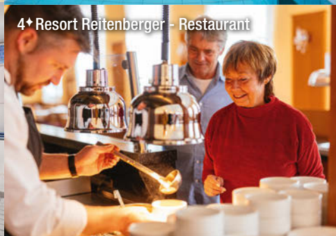
4* Resort Reitenberger - Restaurant