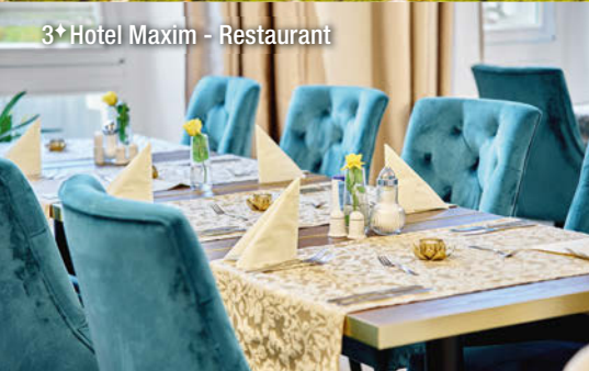
3* Hotel Maxim - Restaurant