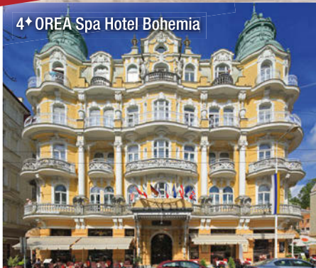
4+ OREA Spa Hotel Bohemia

Verpflegung: Das ausgezeichnete Hotelrestaurant verwöhnt Sie mit einer großen Auswahl an Spezialitäten der böhmischen und internationalen Küche. Morgens und abends bedienen Sie sich vom reichhaltigen Buffet.