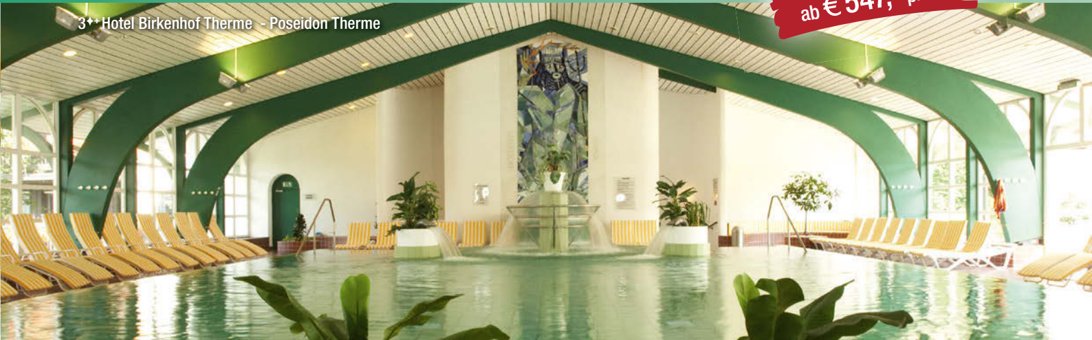
3++ Hotel Birkenhof Terme - Poseidon Terme