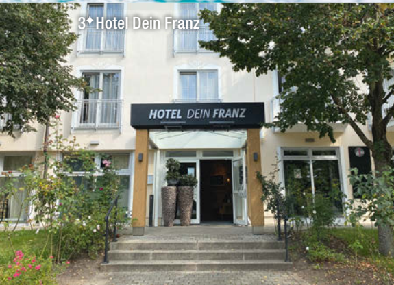
3* Hotel Dein Franz