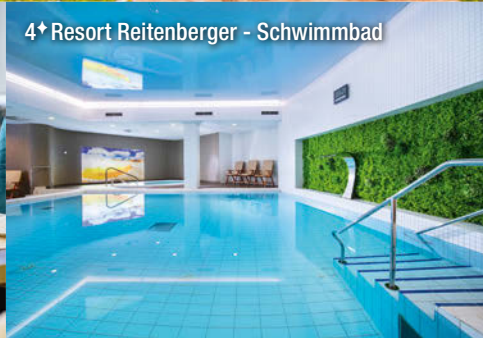
4* Resort Reitenberger - Schwimmbad