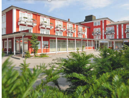
3+ Hotel Füssinger Hof

Freizeit/Kur/Unterhaltung: Entspannung finden Sie u.a. auf der Liegewiese oder in der hoteleigenen Therapieabteilung, wo Ihnen gegen Aufpreis Massagen, Wärmepackungen, Heißluft, Fußreflexzonenmassagen und Lymphdrainagen angeboten werden.