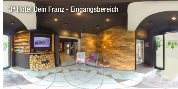
3* Hotel Dein Franz - Eingangsbereich

➤ Für Ihren Aufenthalt empfehlen wir den Abschluss einer gesonderten Reiseversicherung (Rücktritts-, Gepäckversicherung etc.). Wir beraten Sie gerne!