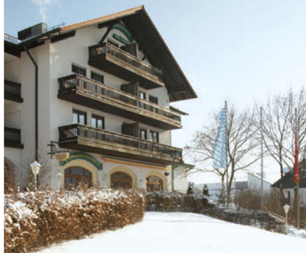
3++ Hotel Birkenhof Terme

Freizeit/Kur/Unterhaltung: Schöpfen Sie neue Kraft in der hauseigenen, 1.600 m 2 großen „Poseidon-Therme“. Hier erwarten Sie ein beheiztes Süßwasser-Freibad (15 x 8 m, ca. 28°C), Thermal-Innenbecken (13 x 8 m, ca. 36°C), Kneipp-Tretbecken, Hot-Whirlpool, Dampfgrotte, Infrarotkabine, Solarium (gg. Aufpreis) und eine gepflegte Liegewiese. Im Beautybereich und der Physiotherapie-Abteilung der Terme können Sie sich gegen Aufpreis bei vielseitigen Wellness- und Therapieangeboten verwöhnen lassen. Alternativ können Sie im Hotel Nordic Walking-Stöcke (kostenfrei, nach Verfügbarkeit) leihen und die schöne Umgebung aktiv erkunden.